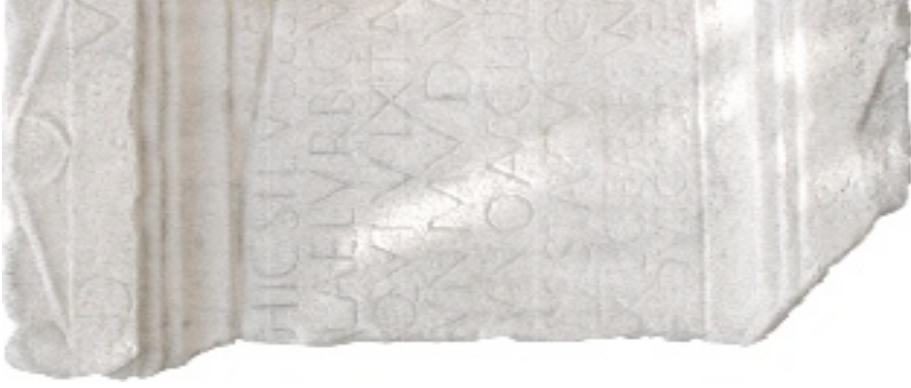
Grabstein vom Zürcher Lindenhof mit der frühesten Nennung von Turicum (CIL XIII 5244)

• die finanzielle Unterstützung danken wir: