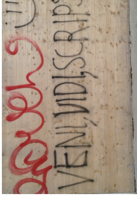
Graffiti am Heimplatz, Zürich, April 2016